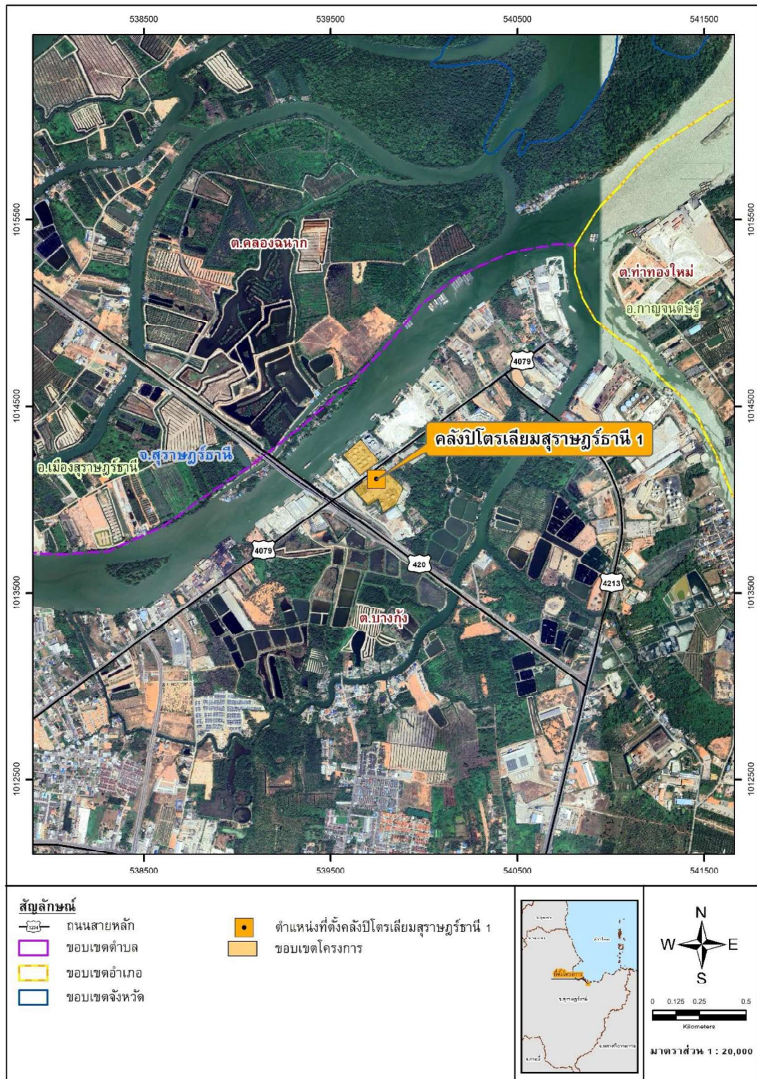
รูปที่ 1.4-1 ที่ตั้งและขนาดโครงการ