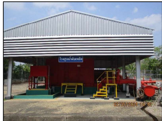
โรงสูบน้ำดับเพลิง