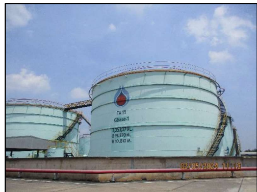
คลังน้ำมัน