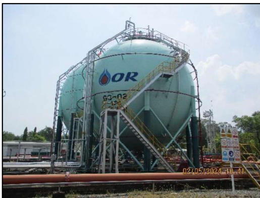
คลังก๊าซปิโตรเลียมเหลว

3.2) ท่าเทียบเรือขนถ่ายก๊าซปิโตรเลียมเหลว อยู่ห่างจากท่าเทียบเรือขนถ่ายน้ำมันประมาณ 30 เมตร มีลักษณะเป็นสะพานเทียบเรือ (Jetty) รูปตัวที ยื่นออกไปในแม่น้ำตาปีทางทิศเหนือ ระยะห่างจากฝั่ง 20 เมตร ความยาวท่าเทียบเรือรวมหลักเทียบเรือ 36 เมตร ความยาวระหว่างพุกเรือ 83 เมตร ความลึกเฉลี่ยของหน้าท่าลึก 4.5 เมตรจากระดับน้ำต่ำสุด สามารถรับเรือขนาดไม่เกิน 1,250 ตันกรอสส์ และเรือที่จะเข้าเทียบท่าต้องมีความยาวตลอดลำไม่เกิน 65 เมตร กรณีท่าเทียบเรือมีเรือเทียบท่าอยู่ก่อนแล้ว เรือที่จะเข้าเทียบท่า ต้องมีความยาวตลอดลำไม่เกิน 61 เมตร โดยบริเวณท่าเทียบเรือขนถ่ายก๊าซปิโตรเลียมเหลวประกอบด้วย สะพานท่าเทียบเรือ หลักผูกเรือ หลักปะทะ พื้นที่ปฏิบัติงาน (Platform) และระบบท่อที่ใช้ในการขนถ่ายก๊าซปิโตรเลียมเหลวขนาดเส้นผ่าศูนย์กลาง 8 นิ้ว จำนวน 1 ท่อ และเส้นผ่าศูนย์กลาง 6 นิ้ว จำนวน 1 ท่อ