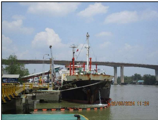
ท่าเทียบเรือ